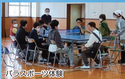
パラスポーツ体験