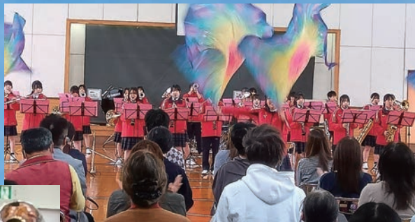
高松中央高校 吹奏楽部の皆様