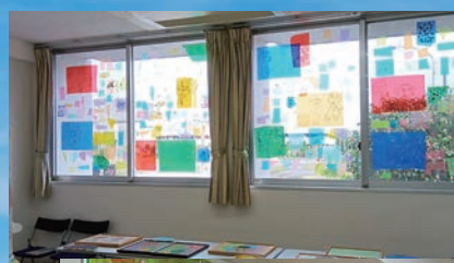
アートリンク展覧会