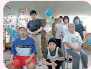
施設で「七夕まつり」をしました。短冊に願い事を書いたり、かき氷を食べたりゲームをしたり楽しく過ごしていただきました。

障害者支援施設 銀星の家 ..... 2 施設入所支援・生活介護・短期入所 共生型通所介護 障害福祉サービス事業 ぎんせいワーク ..... 3 生活介護・就労継続支援B型